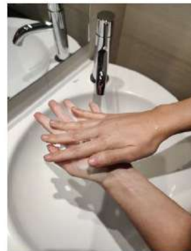
Frota las palmas entre sí,