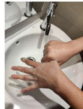
el pulgar con la palma de la mano,