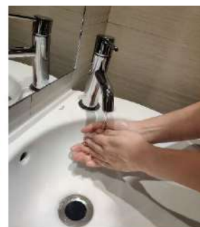
Enjuágate las manos.

Cuando se laven las manos con gel hidroalcohólico no será preciso mojar las manos.