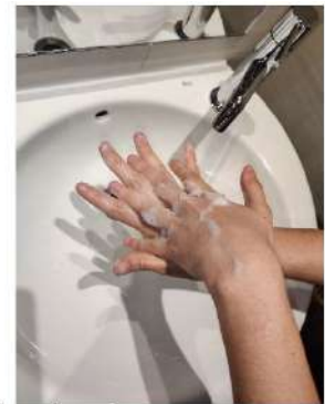
la palma de una mano contra el dorso de la otra, entrelazando los dedos y viceversa,