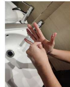
la punta de los dedos contra la palma, rotando,