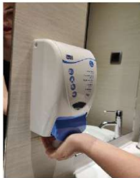
Deposita suficiente jabón en las palmas.