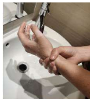
y continua lavando las muñecas.