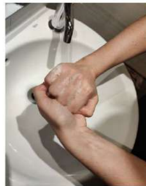
el dorso de los dedos con la palma opuesta,