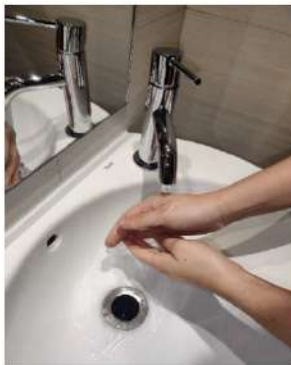
Mójate las manos.