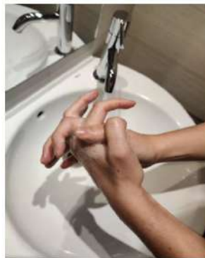
las palmas entre sí, con los dedos entrelazados,